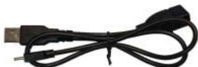
Y-kabel USB-A naar USB-C (EL0179)