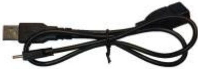
Y-kabel USB-A naar USB-C (EL0179)