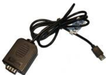
Kabel RS232 naar USB-C (EL0210)

Als de Modbus-kabel is klaar gemaakt, kan de Jullix geïnstalleerd en aangesloten worden.